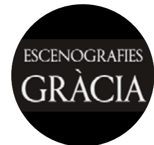
ESCENOGRAFIES GRÀCIA Escenografia