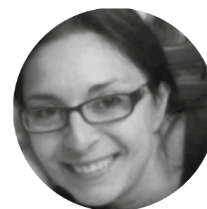
Mª LUISA TALAVERA Escenografía