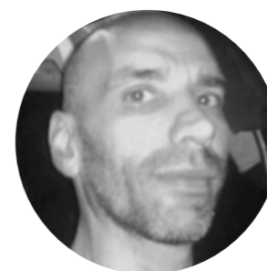
MANUEL ÁLVAREZ Escenografía