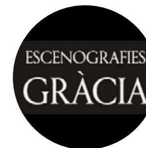
ESCENOGRAFIES GRÀCIA Escenografía