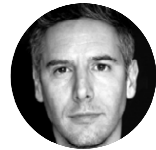
ARTUR PALOMO Voz en Off