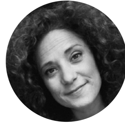
GEORGINA CORT Actriz / Cantante