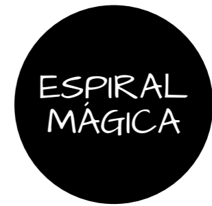
ESPIRAL MÁGICA Escenografía y Espacio Escénico